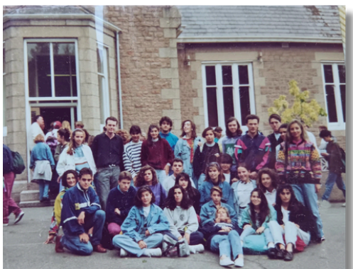
NUESTROS INICIOS: Año 1990. Viaje a la Isla de Jersey

Si desean conocer las experiencias de antiguos estudiantes, les pondremos en contacto con familias que han confiado en nuestros servicios.